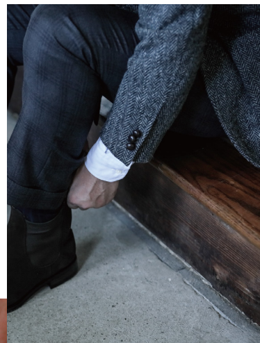
Order Suit ¥58,000 John Foster (Made in England)