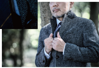
Order Jacket ¥49,000~ Harris Tweed (Made in Scotland)